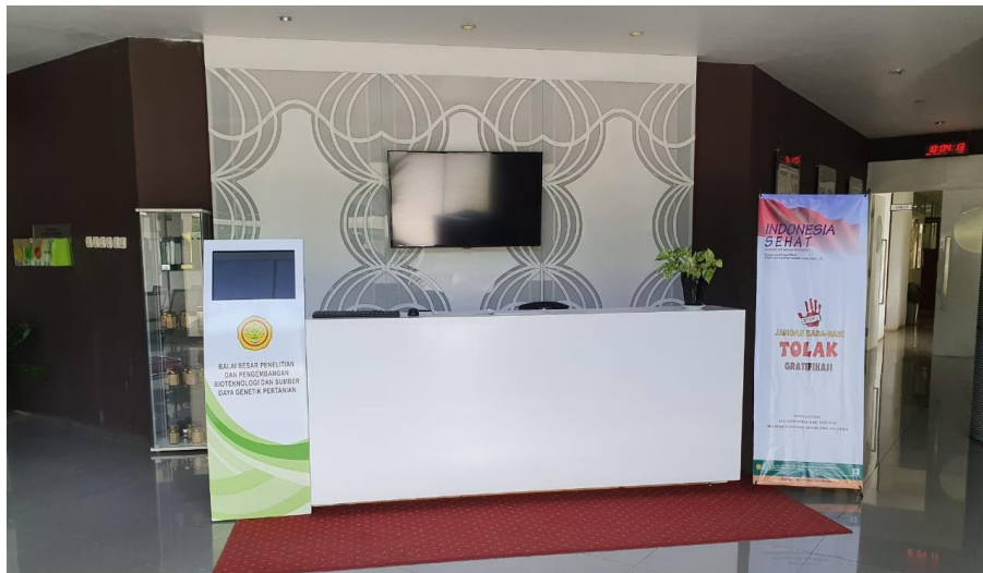
Front Desk BBPSI Biogen

Sampai dengan tahun 2023 ini, dukungan sarana dan prasarana pelayanan publik antara lain: ruang pelayanan publik, ruang tunggu, ruang laktasi, sarana ibadah, ramp untuk jalur difabel, perpustakaan dilengkapi dengan meja membaca, komputer layanan pengunjung, rak leaflet, tempat ibadah, tempat parkir dan free WiFi.