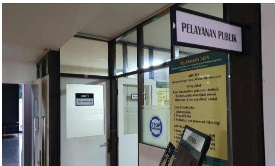
Ruang Pelayanan Publik BBPSI Biogen