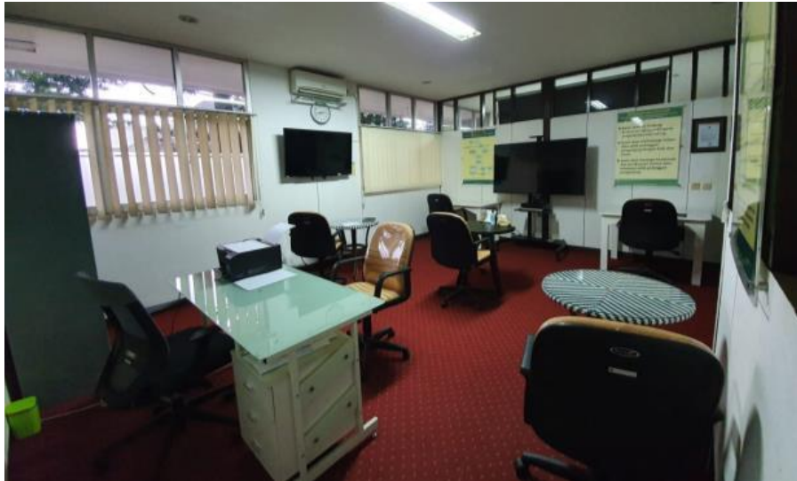
Ruang Pelayanan Publik BBPSI Biogen Tampak Dalam