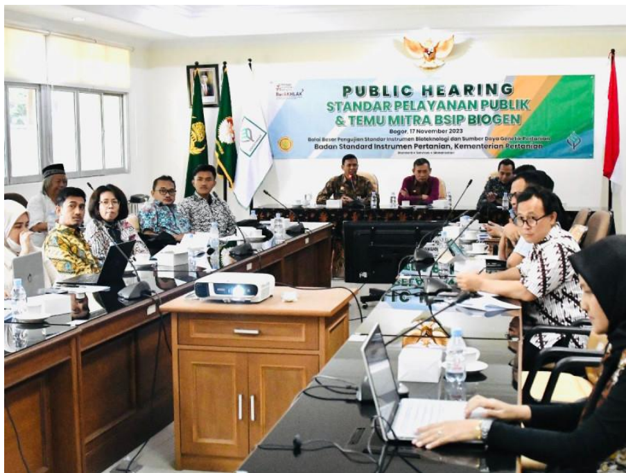
Public Hearing Standar Pelayanan Publik dan Temu Mitra BBPSI Biogen pada Tanggal 17 November 2023 di BBPSI Biogen

Di sisi layanan kepada masyarakat, tahun 2023 ini ditandai dengan upaya maksimal dalam memberikan pelayanan terbaik kepada para pemangku kepentingan. Pada tanggal 17 November 2023 BBPSI Biogen telah melakukan public hearing standar pelayanan publik kepada mitra-mitra BBPSI Biogen. Nilai Indeks Kepuasan Masyarakat meningkat dari Semester I ke Semester II tahun 2023 mengalami peningkatan dari 85,43 ke 86,32 Nilai tersebut menunjukkan bahwa mutu pelayanan publik BBPSI Biogen adalah baik berdasarkan pada Permenpan-RB Nomor 14 Tahun 2017 tentang Pedoman Penyusunan Survei Kepuasan Masyarakat Unit Penyelenggara Pelayanan Publik.